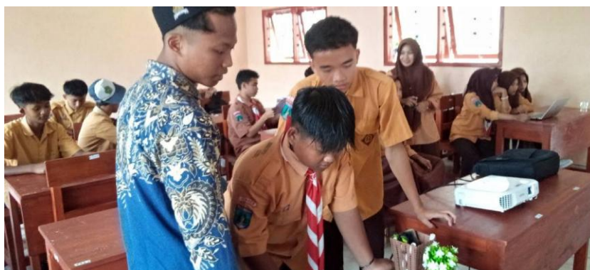
Gambar 3. Pendampingan praktik penggunaan Microsoft Word kepada peserta pelatihan.

Setelah penyampaian materi, kegiatan dilanjutkan dengan sesi praktik terbimbing menggunakan komputer. Peserta belajar mengenali antarmuka Microsoft Word, membuat dokumen sederhana, mengatur format huruf, mengelola paragraf dan spasi, serta menyimpan dokumen dengan benar. Melalui pendekatan praktik terbimbing, peserta dapat langsung menerapkan setiap materi yang dipelajari, sehingga proses pembelajaran berlangsung lebih aktif dan mudah dicerna. Sebagian besar peserta mampu menyelesaikan tugas yang diberikan sesuai instruksi, sementara peserta yang mengalami kesulitan mendapatkan pendampingan langsung dari tim. Hal ini menunjukkan bahwa kegiatan pelatihan berhasil membantu peserta memahami penggunaan dasar Microsoft Word secara lebih baik.