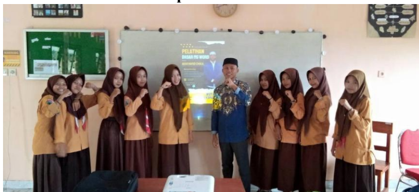
Gambar 4. Dokumentasi bersama peserta pelatihan dasar Microsoft Word.