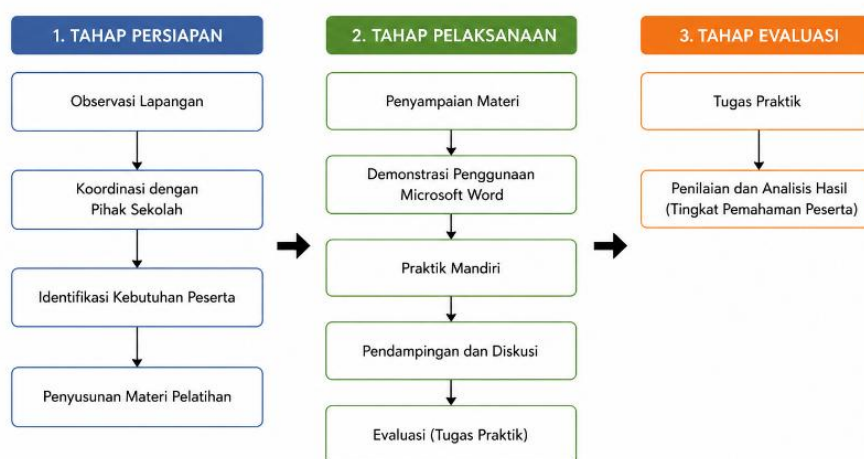
Gambar 1. Alur Pelaksanaan Kegiatan Pengabdian