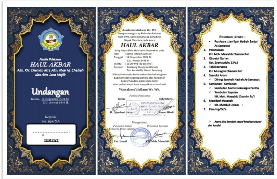
Gambar 2. Rowndown kegiatan khaul Kh. Kh. Achmad Chamim Ro’I

Kemudian pagi hari pada tanggal 13 Nopember 2024 diadakan kegiatan tahlil bersama yang dipimpin oleh Dzuriyah Kh. Achmad Chamim Ro’i oleh KH. Mawahib Chamim Ro’I, berikut untuk petunjuk teknis khaul KH. Achmad Chamim Ro’i seperti yang ditunjukkan pada gambar 2 dibawah ini.