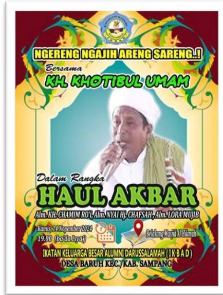
Gambar 4. Undangan Umum khaul KH. Achmad Chamim Ro'i

Sebelum acara inti dimulai pada tanggal 14 Nopember 2024 kami sudah menyebarkan undangan kepada masyarakat, alumni, simpatisan dan khalayak umum untuk bersama mengikuti kegiatan inti yakni khaul KH. Achmad Chamim Ro'i seperti yang ditunjukkan pada gambar 4.