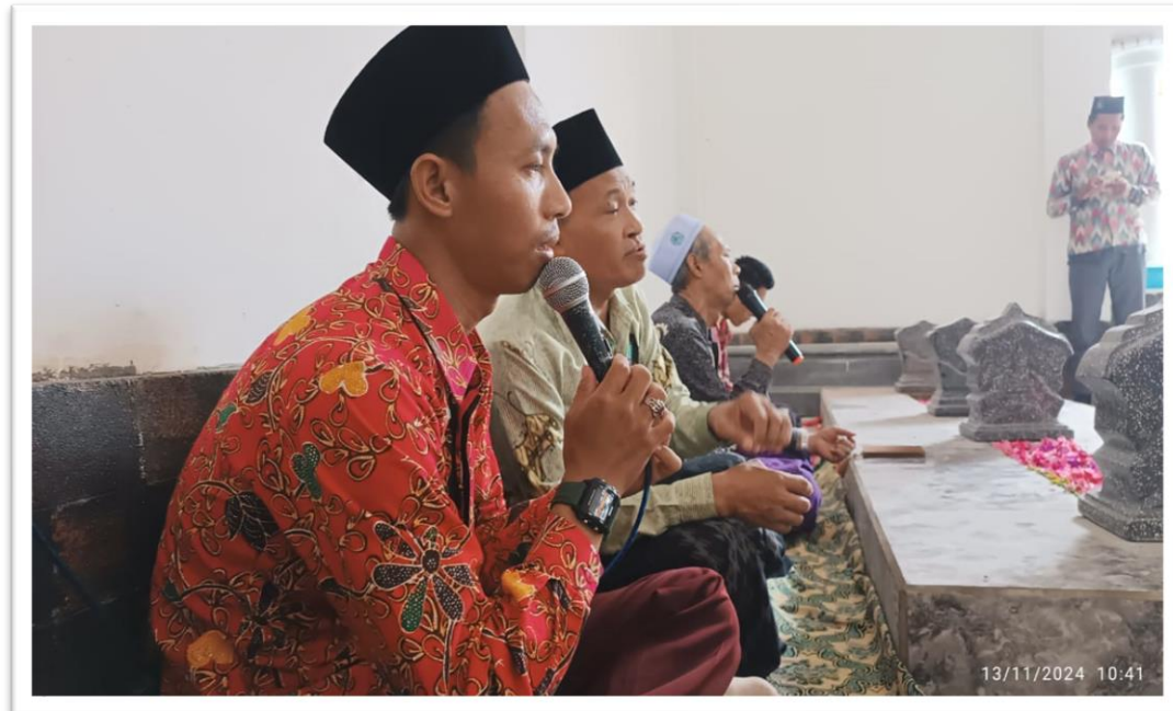
Gambar 3. Dokumentasi Yasinan dan Tahlil Bersama

Agenda selanjutnya adalah tahlil bersama yang pada waktu pagi yang didokumentasikan dan ditunjukkan gambar 3 dan tabel 1.