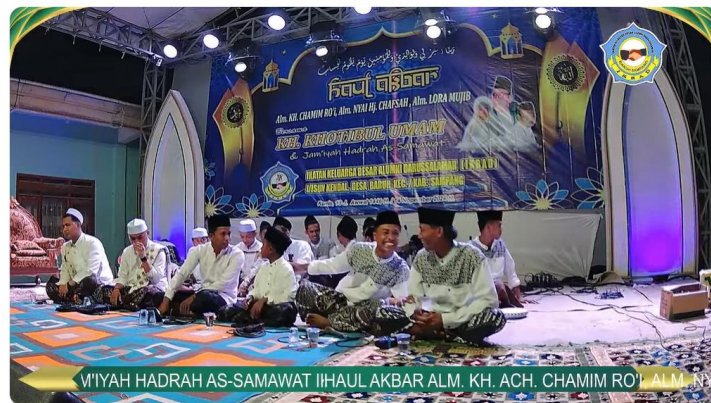
Gambar 5. Jamiyah As Samawat

Tibalah sebelum acara dimulai, pra acara diisi oleh jamiyah sholawat as samawat, lantunan sholawat terpanjang sehingga acara semakin khidmat, berikut kami tunjukkan beberapa dokumentasi pada saat kegiatan sebelum dimulai.